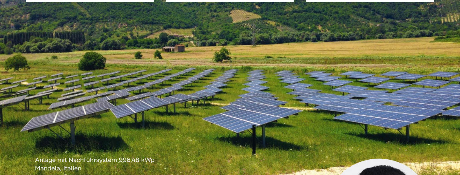
Anlage mit Nachführsystem 996,48 kWp Mandela, Italien

„greentec services setzt auf lückenloses Monitoring und ein umfassendes Fehlermanagement. Seit greentec services unsere Anlagenparks betreut, hat sich die Reaktionszeit stark verkürzt und die Verfügbarkeit merklich verbessert. Dadurch profitieren wir von wesentlichen Mehrerträgen.“