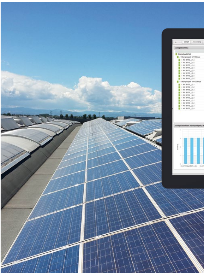
Sistema integrado en el tejado 1.376,32 kWp Monticelli, Italia

Los tiempos de reacción y garantías de rendimiento se pueden acordar con el cliente de forma opcional e individual.