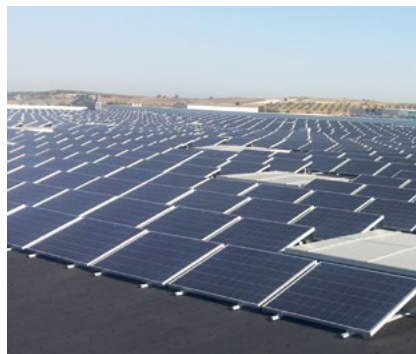
Instalación sobre cubierta 1.145 kWp Ontigola, España