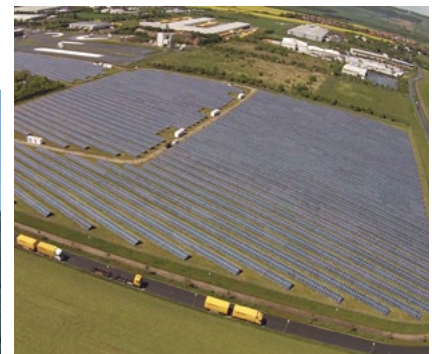
Instalación en suelo 6.092,24 kWp Nohra, Alemania