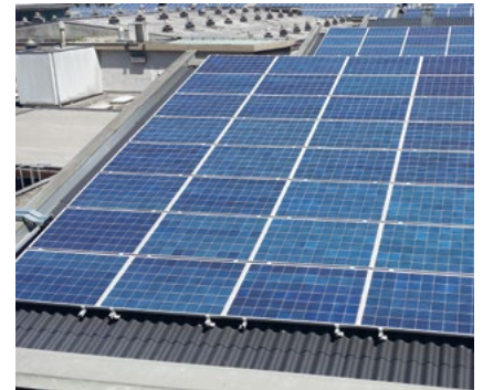
Instalación sobre cubierta 954,77 kWp Dornbirn, Austria

Nuestra Central de asistencia técnica, junto con nuestra red de colaboradores cuidadosamente seleccionados, se responsabilizan de una gestión rápida y eficaz de incidentes para todo tipo de sistemas fotovoltaicos.