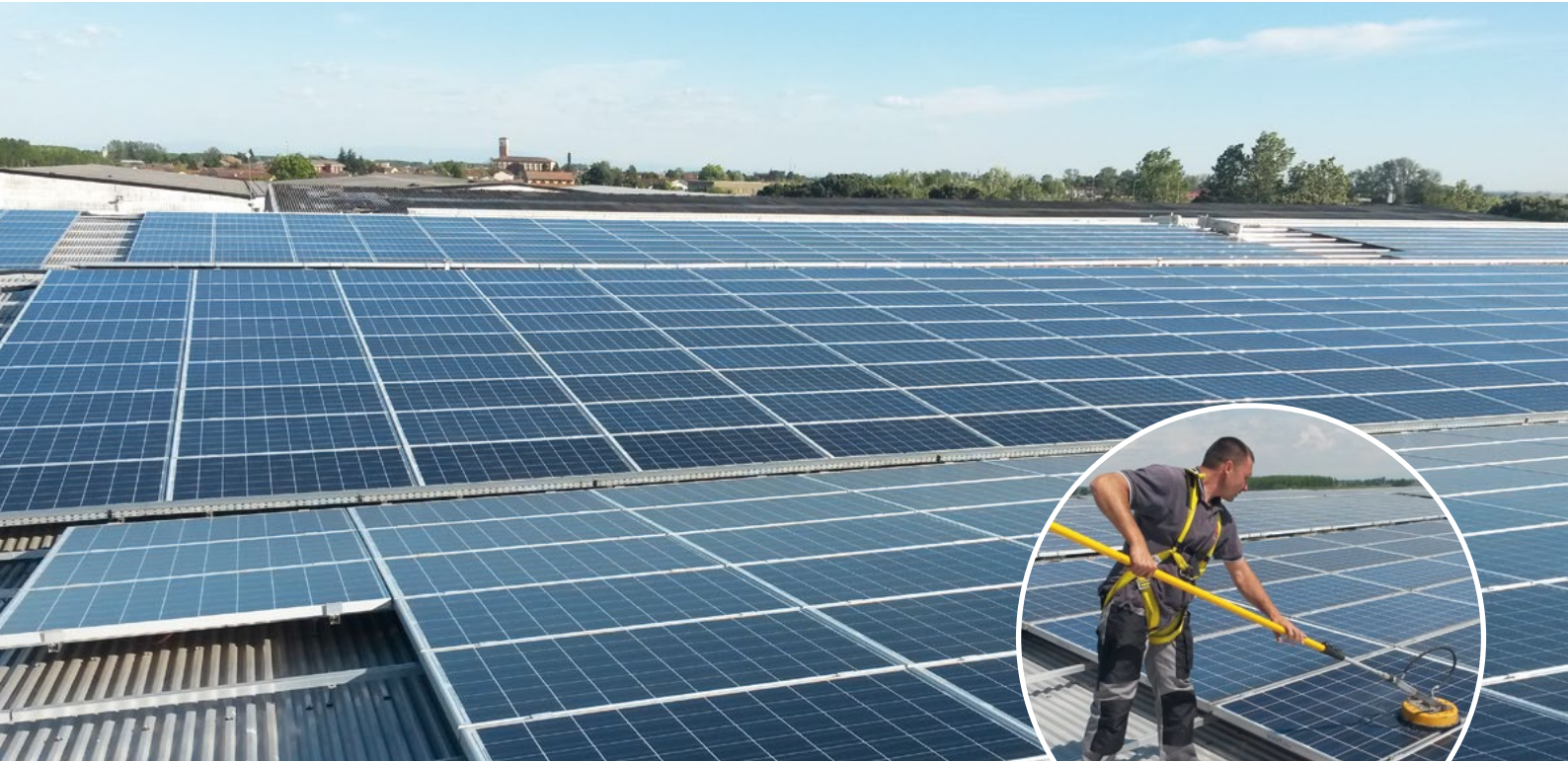
Instalacja dachowa 864 kWp, Novara, Włochy

Zawsze osiągalni. Zawsze gotowi do działania. greentec services sp. z o.o.