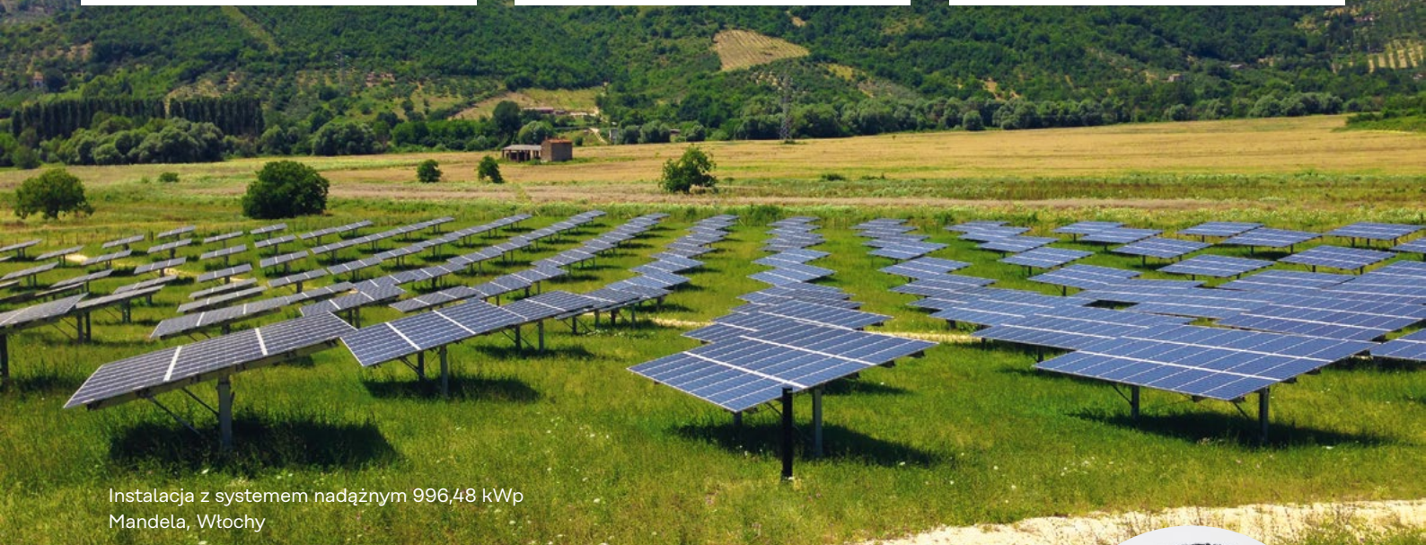
Instalacja z systemem nadążnym 996,48 kWp Mandela, Włochy

„greentec services stawia na pełną usługę monitoringu i kompleksowe zarządzanie sytuacjami usterkowymi. Od momentu przejęcia przez greentec services zarządzania naszymi instalacjami fotowoltaicznymi, czasy reakcji skróciły się stanowczo, dzięki czemu zdecydowanie wzrosła ich dyspozycyjność, co przelożyło się na zwiększenie przychodów ze sprzedaży energii.”