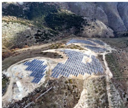
Instalacja naziemna 984 kWp Santopadre, Włochy